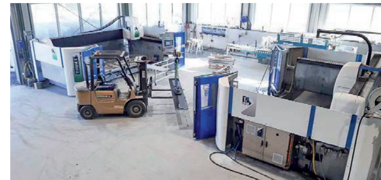
Seit 2016 ist sein Firmenstandort in Großweißenbach 84, ein erweiterter Lagerplatz befindet sich in Böhmhöf 13.