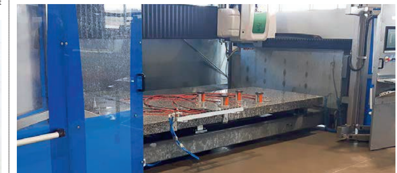
Mit einer CNC-Maschine hat Christian Huber eine große Investition in die Zukunft des Unternehmens getätigt.