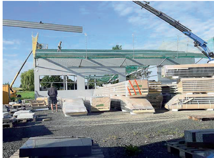
2020 wurde in einen Hallenbau investiert und modernste CNC-Maschinen angeschafft.

in modernster CNC Eigenfertigung. Christian Huber und sein Team stehen für Beratung und Planung, Montage und Verlegung sowie Qualität aus Österreich!