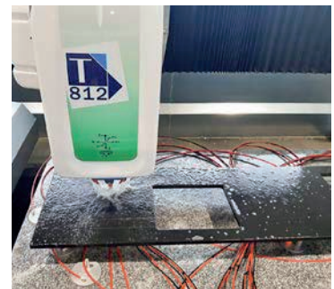
Die CNC-Technik funktioniert millimetergenau.

GROSSWEISSENBACH. CNC-Maschinen (Computerized Numerical Control) sind Werkzeugmaschinen, die durch den Einsatz von Steuerungstechnik in der Lage sind, Werkstücke mit hoher Präzision auch für komplexe Formen automatisch herzustellen. Damit ist es auch Christian Huber möglich, auf individuelle Wünsche hochprofessionell einzugehen.